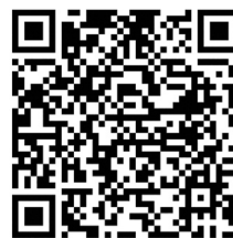
QR-Code Meldeplattform Asiatische Hornisse

Um möglichst rasch Maßnahmen zum Fang der Königinnen und Beseitigung der Nester der Asiatischen Hornisse zu veranlassen, bittet das Ministerium für Umwelt, Klima und Energiewirtschaft um Meldung von Sichtungen in Baden-Württemberg. Dies ist über die Meldeplattform auf der Homepage der Landesanstalt für Umwelt (LUBW), aber auch über die kostenlose „Meine Umwelt-App“ möglich: