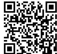
QR-Code Meine Umwelt-App

Weitere Informationen zur Asiatischen Hornisse und wie sich die Art von heimischen Insekten unterscheiden lässt finden sich auf der Homepage der LUBW https://www.lubw.baden-wuerttemberg.de/natur-und-landschaft/asiatische-hornisse sowie auf der Homepage der Landesanstalt für Bienenkunde der Universität Hohenheim unter https://bienenkunde.uni-hohenheim.de/vespavelutina . Dort finden sich auch weitere Informationen, wie Bürgerinnen und Bürger aktiv bei der Suche nach Tieren und Nestern mitwirken können. Seit April 2024 koordiniert die Landesanstalt für Bienenkunde in Stuttgart-Hohenheim im Auftrag der Naturschutzverwaltung das landesweite Management der Asiatischen Hornisse (Kontakt siehe Homepage).