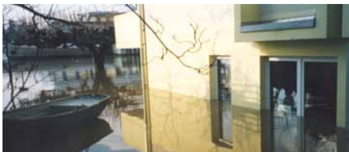
Hochwasser in Königswinter am Rhein