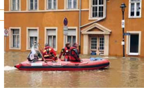
Rettungshelfer beim Hochwasser in Halle, Sachsen-Anhalt, 2013