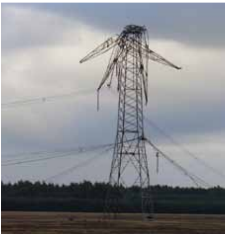
Sturmschaden durch den Orkan Kyrill im Jahr 2007