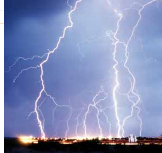
Blitzeinschlag in der Großstadt