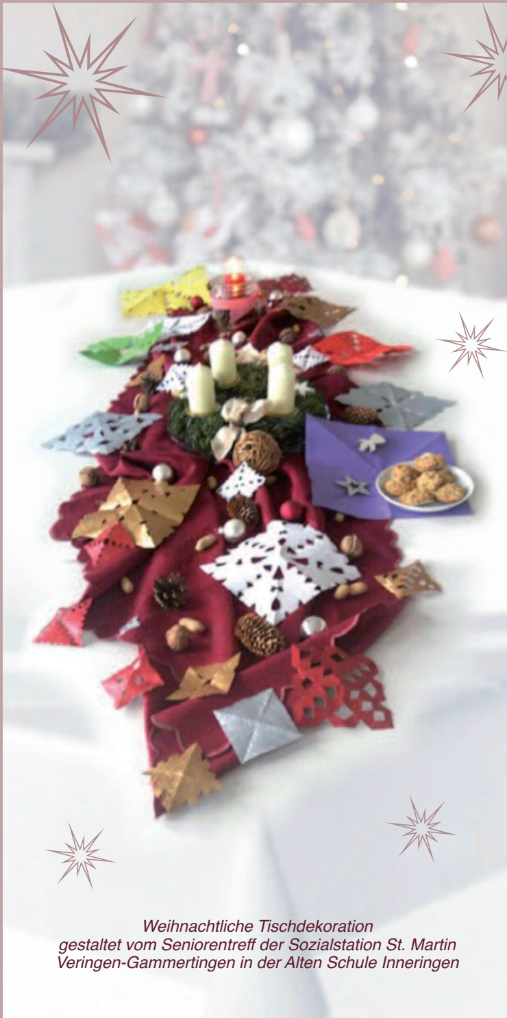
Weihnachtliche Tischdekoration gestaltet vom Seniorentreff der Sozialstation St. Martin Veringen-Gammertingen in der Alten Schule Inneringen