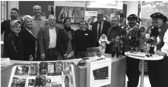
Messebesuch der Bürgermeister/in des GVV-Laucherttal im letzten Jahr