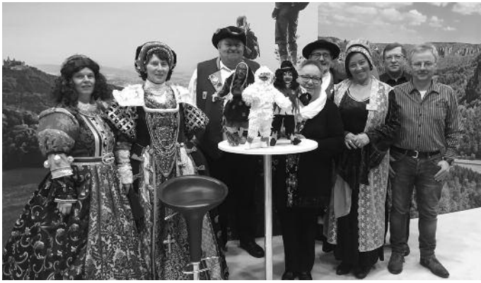
Gruppenbild der letztjährigen Museumsbetreiber