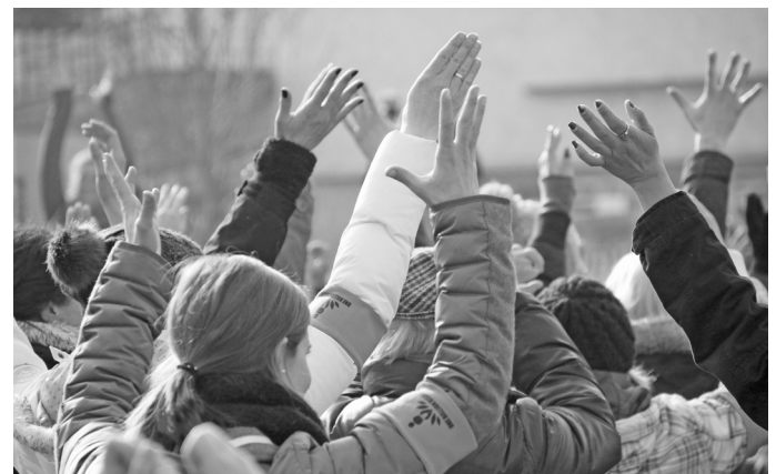
Foto 2: Immer wieder haben die Verantwortlichen öffentlichkeitswirksam auf das Problem der häuslichen Gewalt aufmerksam gemacht – unter anderem mit der Aktion „One Billion Rising“ auf dem Leopoldplatz im Jahr 2017.