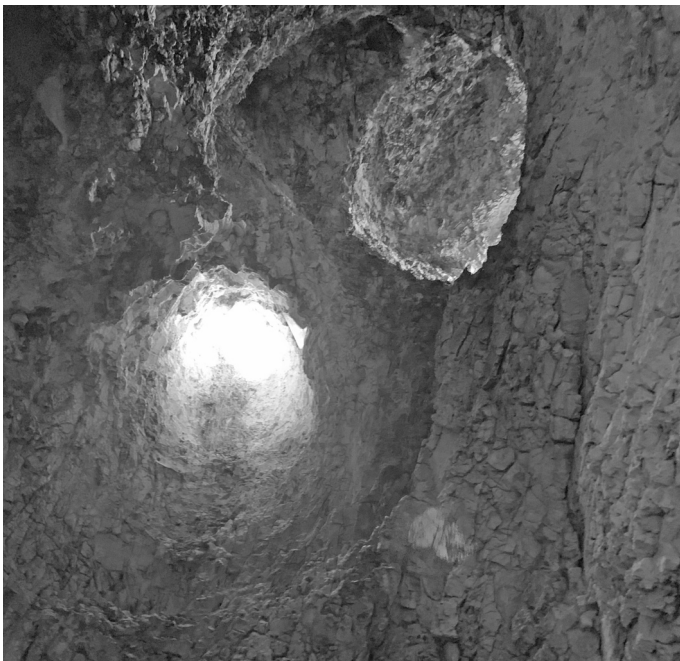
Abbildung: Öffnung über der Halle in der Sirgensteinhöhle bei Blaubeuren