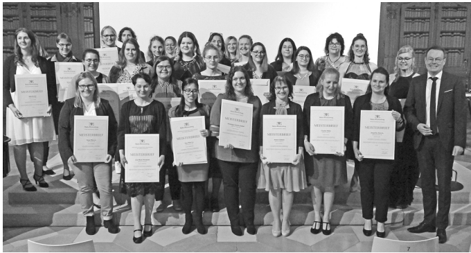
Bildunterschrift: Gruppenbild, Fotografie: Vera Schmid-Dannert, Regierungspräsidium Tübingen.