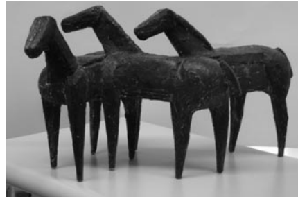
Abbildung: Anton Hiller: Pferdegruppe, 1961, Bronze (Vorlage: Kreisgalerie Schloss Meßkirch)

Holzplastiken sowie Zeichnungen von den figürlichen Anfängen bis hin zur Reduzierung von Form und Ausdruck im Alterswerk gezeigt. Dem in Herkunft und Jugend eng mit Sigmaringen und dem oberen Donautal verbundenen Maler Albert Birkle (1900–1986) ist ein dritter Schwerpunkt gewidmet, der neben Ansichten der heimischen Landschaft Werke im Stil des expressiven Realismus aus seiner wichtigsten Schaffensperiode in den 1920er-Jahren enthält. Der Eintritt in die Kreisgalerie beträgt regulär 3 Euro und ermäßigt 1,50 Euro. Die Teilnahme an der Führung ist kostenfrei. Die Kreisgalerie ist freitags bis sonntags sowie feiertags jeweils von 14 bis 17 Uhr geöffnet.