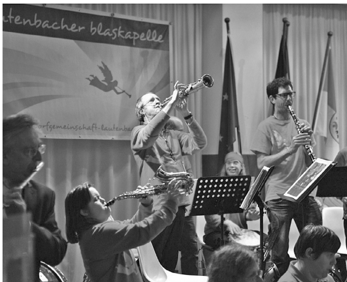
Bildunterschriften Foto 1: Die Lautenbacher Blaskapelle wird das Programm mit fetzigen Klängen eröffnen.

Der Galaabend wird von den Sparkassen im Landkreis gefördert. Die Teilnahme ist kostenfrei, Spenden sind willkommen. Anmeldungen werden entgegengenommen unter der Telefonnummer 07571/102-1141 und per E-Mail an kultur@irasig.de.