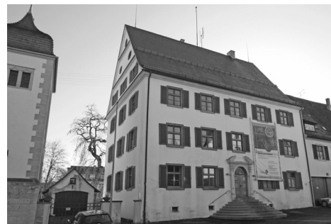
Foto 2: Eines der Ziele bei der Exkursion am 22. Juli: Das Alte Oberamt war bis 1925 der Sitz der hohenzollerischen und sodann preußischen Oberämter in Gammertingen.