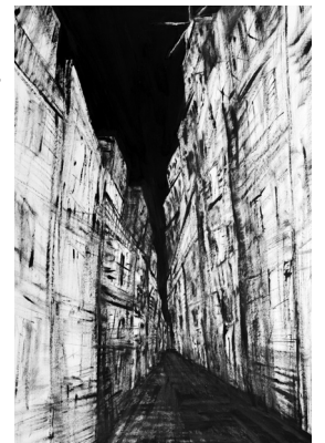
Foto 1: Diese Arbeit von Jenny Reininger – Santorini I, Öl auf Papier, 2022 – zählt zu den 60 Ausstellungsstücken, die ab dem 16. Juli in der Kreisgalerie Schloss Meßkirch zu sehen sind.

Eintrittskarten im Vorverkauf gibt es bei der Buchhandlung Rabe, Telefon: 07571/52296, und bei KuKu, Telefon: 07571/13081, E-Mail: kunst-und-kultur@t-online.de . Der Eintritt kostet regulär 20 Euro, für KuKu-Mitglieder 18 Euro sowie für Schülerinnen und Schüler, Studierende und Absolvierte eines Bundesfreiwilligendienstes (BFD) 10 €. Spenden werden gerne entgegengenommen.