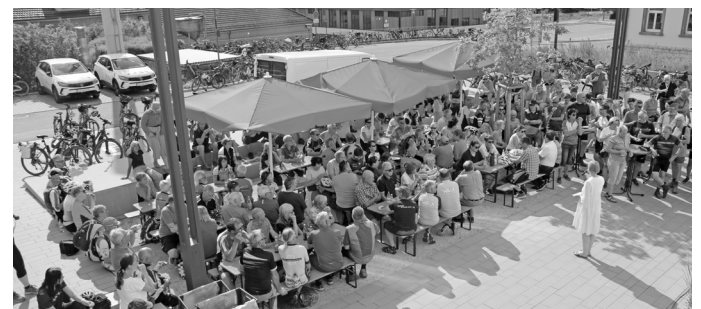
Foto 2: Landrätin Stefanie Bürkle empfängt die Teilnehmenden am Landratsamt: „Ich hoffe auf viele gefahrene Kilometer mit dem Rad.“