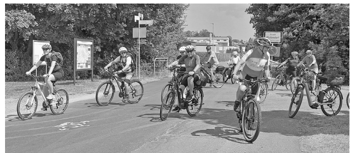
Foto 1: Bei der Sternfahrt führt der Weg für die Radfahrenden über fünf Äste nach Sigmaringen. Auch von Pfullendorf aus starten zahlreiche Radlerinnen und Radler.

Bis der Wettbewerb am 6. Juli endet, geht es mit dem Stadtradeln im Landkreis Sigmaringen verstärkt um nachhaltige Mobilität, Bewegung, Klimaschutz und Teamgeist. Die Teilnehmenden sind in dieser Zeit dazu eingeladen, im Alltag möglichst viele Kilometer mit dem Rad zurückzulegen und somit gemeinsam ein Zeichen für nachhaltige Mobilität zu setzen. Auch Kurzentschlossene können sich der Aktion noch anschließen. Die Möglichkeit zur Anmeldung, weitere Informationen sowie Vorschlagsmöglichkeiten zur Optimierung der Radstrecken sind auf der Internetseite www.stadtradeln.de zu finden.