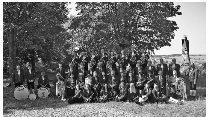
Foto 1: Die Musikkapelle Feldhausen-Harthausen richtet an gleich zwei Wochenenden im September das Kreismusikfest des Blasmusikverbands Sigmaringen aus.

Eine kindgerechte Familienwanderung veranstaltet die Ortsgruppe Gammertingen im Schwäbischen Albverein am Sonntag, 24. September , um 14 Uhr . Im Raum der früheren Ritterherrschaft Gammertingen-Hettingen suchen die Teilnehmenden Grenzsteine, identifizieren diese, lernen die Inschriften kennen und dokumentieren diese schriftlich. Der spannende Exkurs durch die Grenzen von Württemberg und Hohenzollern beziehungsweise Preußen wird von Wanderführerin Priska Pfister begleitet und startet auf dem Parkplatz gegenüber der katholischen Kirche St. Leodegar in Gammertingen. Weitere Informationen und die Möglichkeit zur Anmeldung gibt es bei Priska Pfister unter der Telefonnummer 07574/4189 und per E-Mail an priska-pfister@web.de .