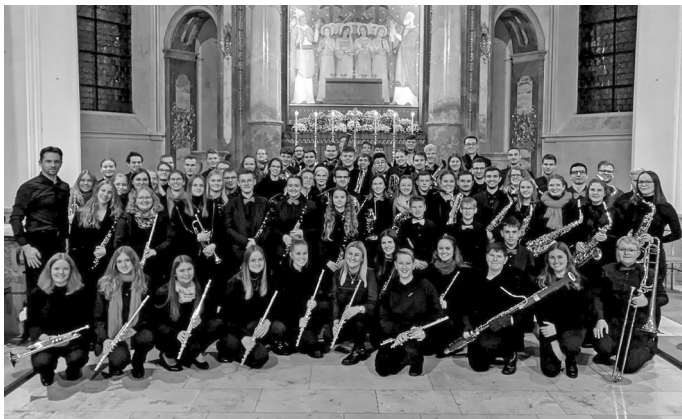
Foto 1: Die Musikerinnen und Musiker des Kreisverbandsjugendorchesters beim letzten Konzert 2022 vor der imposanten Kulisse der Beuroner Klosterkirche.

Das Konzert des Kreisverbandsjugendorchesters ist einer der musikalischen Höhepunkte im Jahresprogramm der Erzabtei St. Martin zu Beuron. In der besonderen Atmosphäre der Klosterkirche erwarten die Zuhörerinnen und Zuhörer festliche, imposante, aber auch besinnliche Melodien und Klänge.