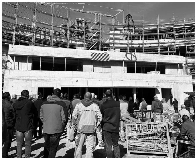
Mit der Fertigstellung des Rohbaus befindet sich der Neubau der Bertha-Benz-Schule in Sigmaringen auf der Zielgeraden.

Bitte Bilde einfügen: 15 2024 PM Landkreis feiert Richtfest der Bertha-Benz-Schule