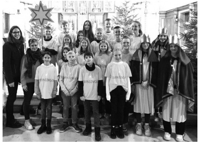
Die Sternsinger aus Inneringen