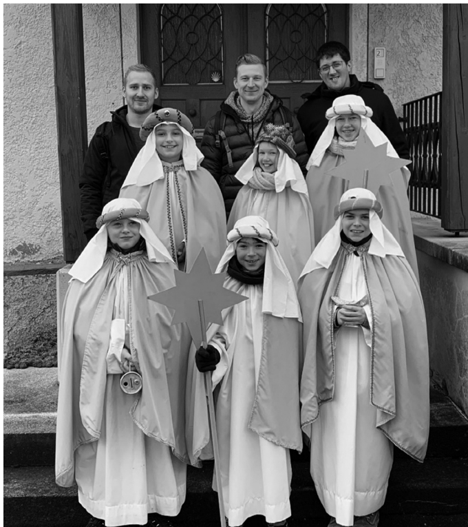
Die Sternsinger aus Hettingen

Die Zahlen der gesammelten Spenden werden wir zu einem späteren Zeitpunkt veröffentlichen.