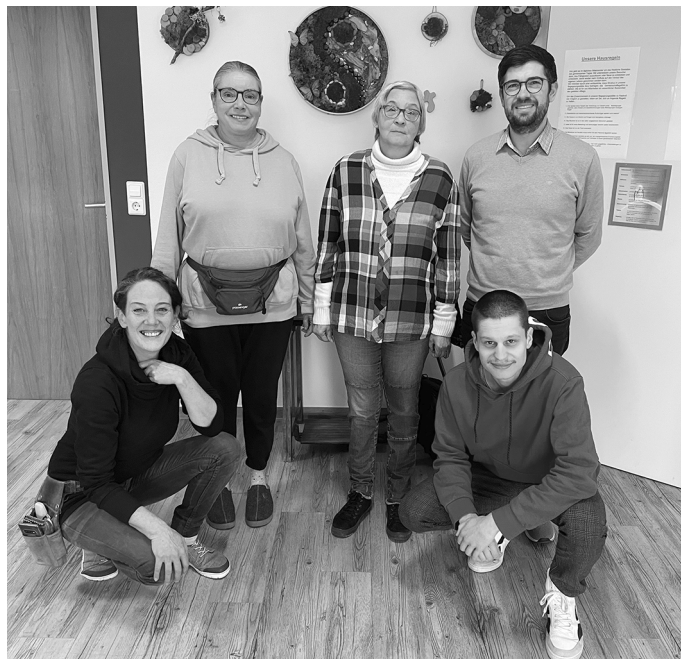
Besucher und MitarbeiterInnen der Begegnungsstätte für psychisch kranke Menschen hoffen auf Spenden für die notwendige Raumerweiterung

VR Payment für Viele schaffen mehr IBAN: DE33660600000000137749 BIC: GENODE6KXXX Verwendungszweck: P29186 - Erweiterung Begegnungsstätte für psychisch kranke Menschen